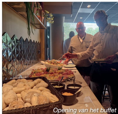
Opening van het buffet