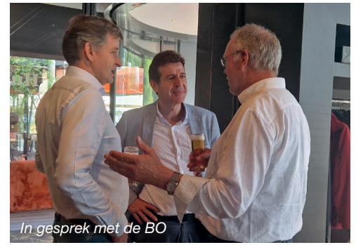
In gesprek met de BO

Na de receptie was er een gezamenlijke maaltijd voor NAV-leden. Het was een geslaagde dag waarin de NAV op een feestelijke manier afscheid nam van haar voorzitter en de nieuwe voorzitter welkom heette. NAV