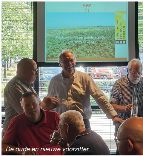
De oude en nieuwe voorzitter

Vervolgens gingen we naar 't Voorhuys in Emmeloord, waar we begonnen met een korte presentatie over het verduurzamingschema waar de NAV aan werkt (zie p4). De reacties hierop waren positief.