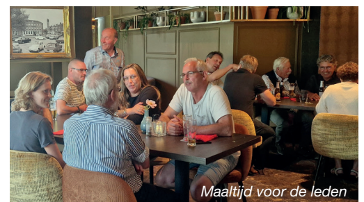
Maaltijd voor de leden